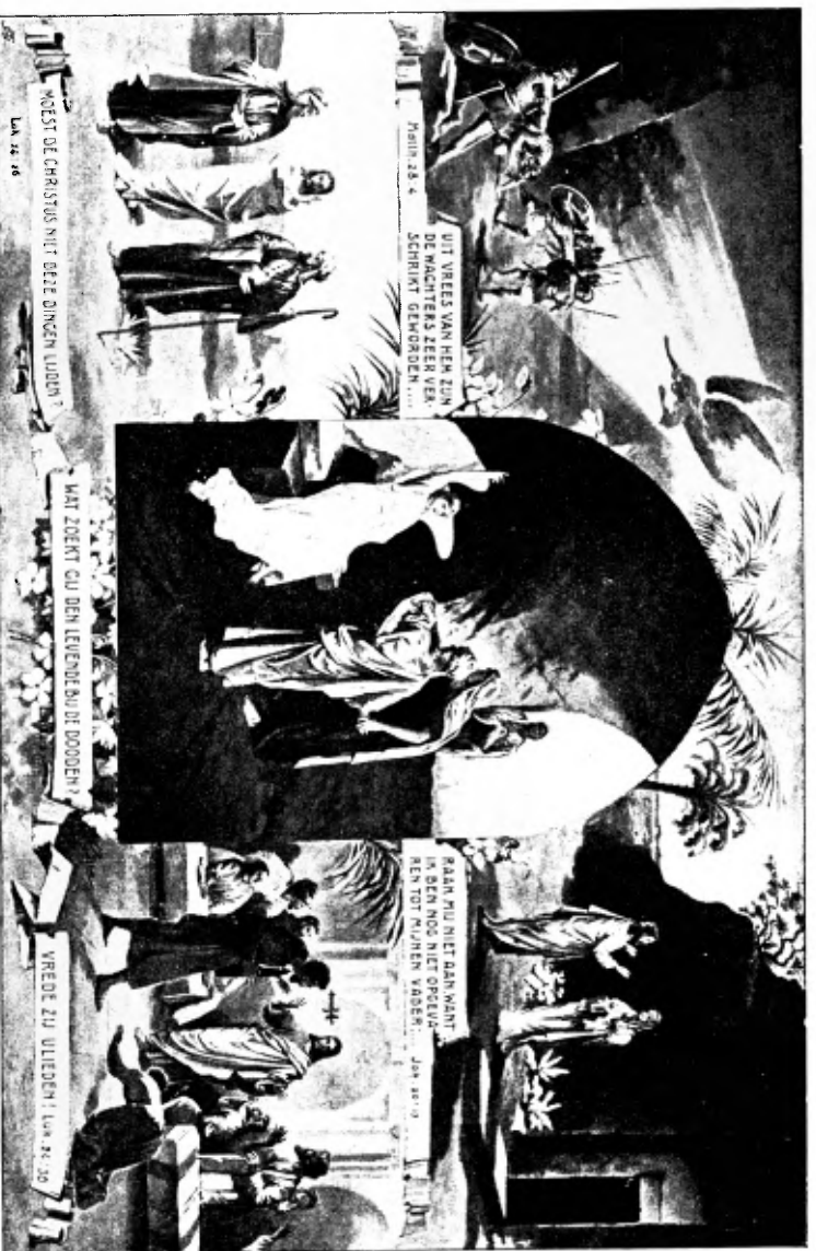
Verkleinde afdruk van de Paaschplaat van Rünckel, genoemd op pag. 14.